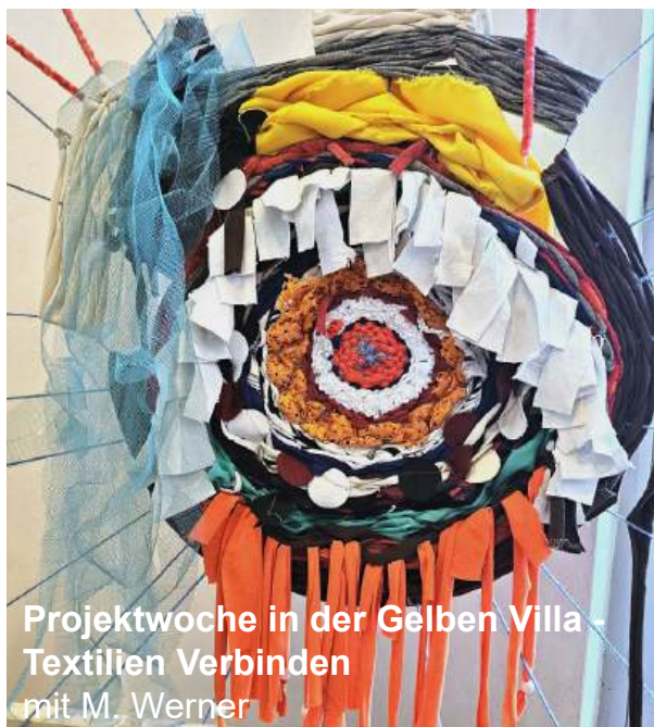
Projektwoche in der Gelben Villa Textilien Verbinden mit M. Werner