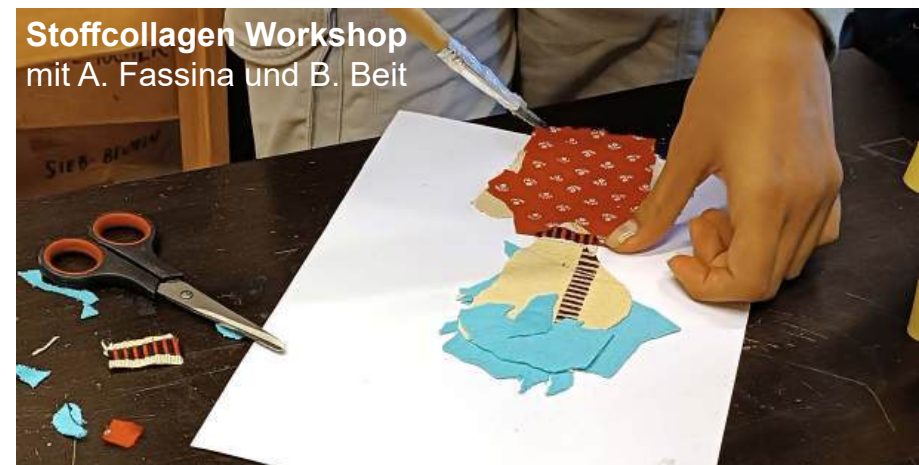
Stoffcollagen Workshop mit A. Fassina und B. Beit