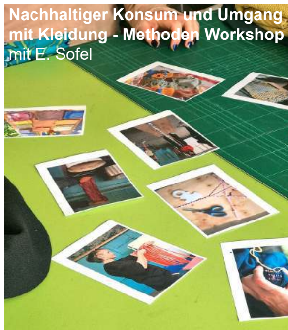
Nachhaltiger Konsum und Umgang mit Kleidung - Methoden Workshop mit E. Sofel