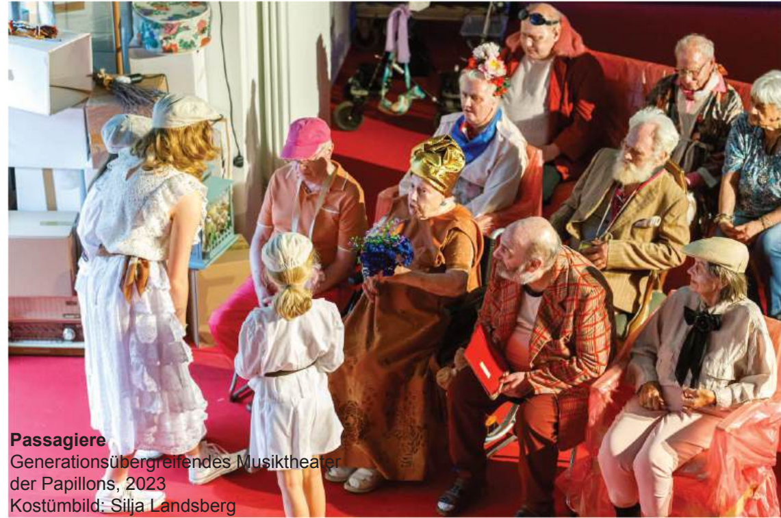
Passagiere Generationsübergreifendes Musiktheater der Papillons, 2023 Kostümbild: Silja Landsberg