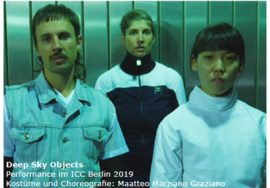
Deep Sky Objects Performance im ICC Berlin 2019 Kostüme und Choreografie: Maatteo Marziano Graziano