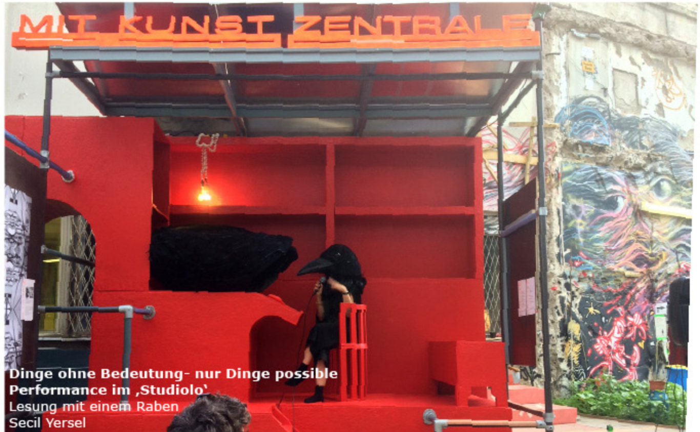
Dinge ohne Bedeutung- nur Dinge possible Performance im ‚Studiolo‘ Lesung mit einem Raben Secil Yersel