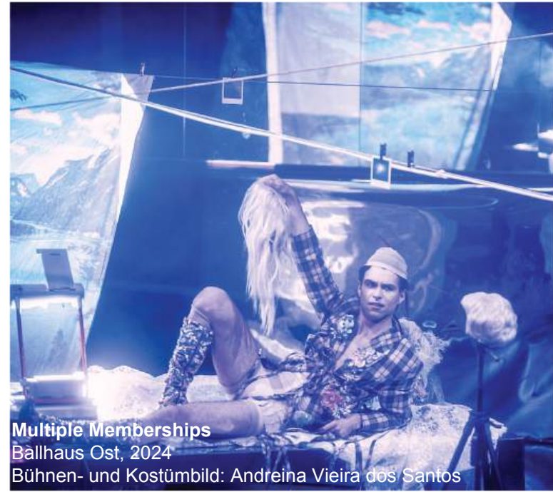
Multiple Memberships Ballhaus Ost, 2024 Bühnen- und Kostümbild: Andreina Vieira dos Santos