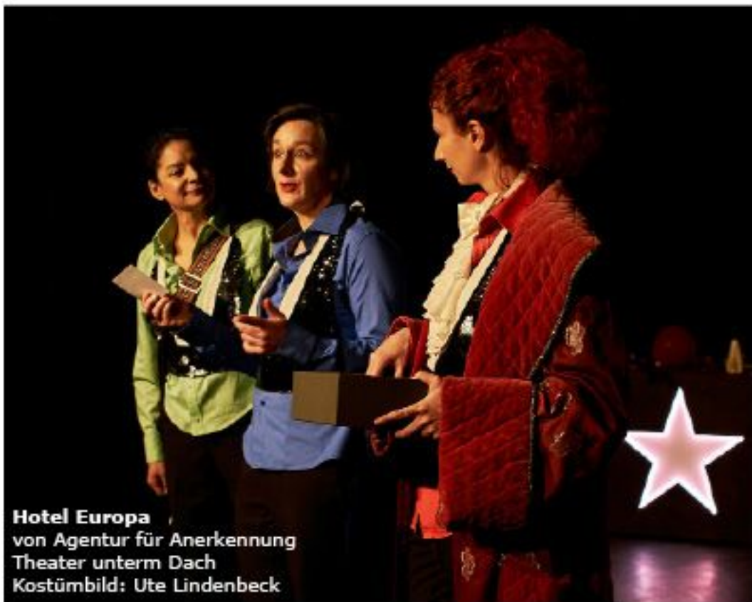
Hotel Europa von Agentur für Anerkennung Theater unterm Dach Kostümbild: Ute Lindenbeck