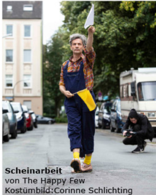
Scheinarbeit von The Happy Few Kostümbild: Corinne Schlichting