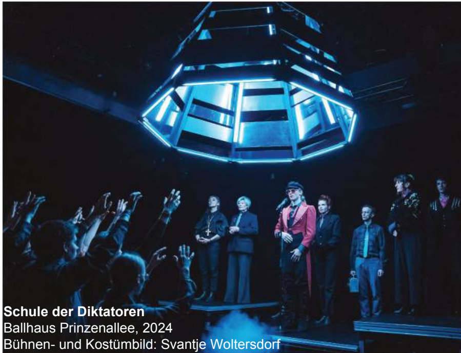
Schule der Diktatoren Ballhaus Prinzenallee, 2024 Bühnen- und Kostümbild: Svantje Woltersdorf