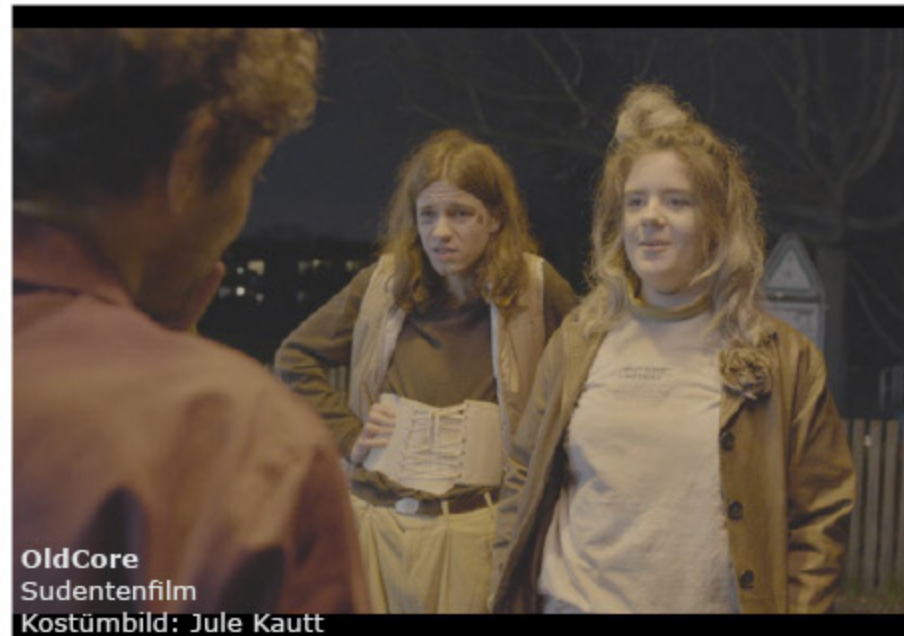
OldCore Studentenfilm Kostümbild: Jule Kautt