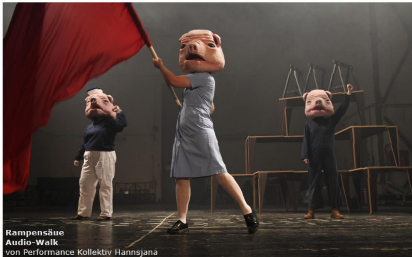
Rampensäue Audio-Walk von Performance Kollektiv Hannsjana