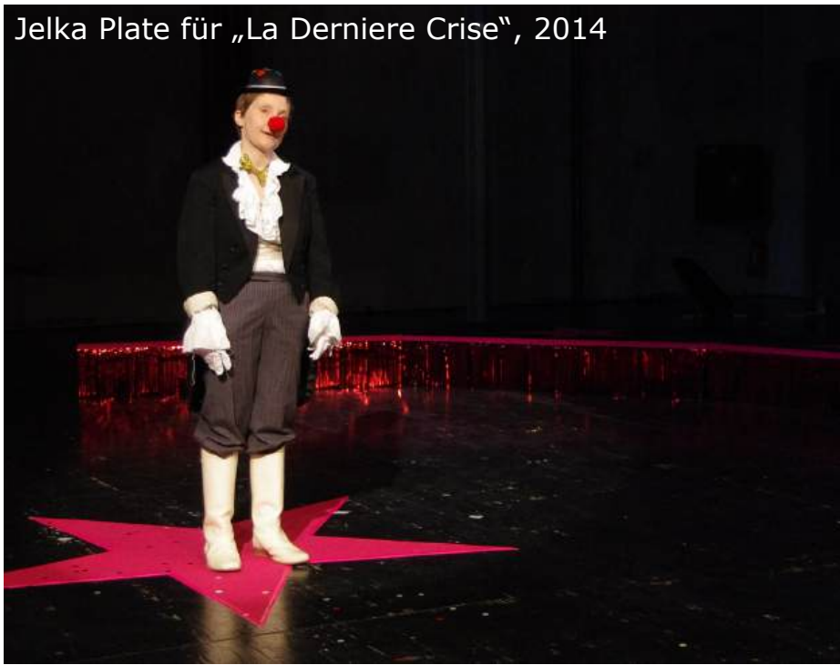
Jelka Plate für „La Derniere Crise“, 2014