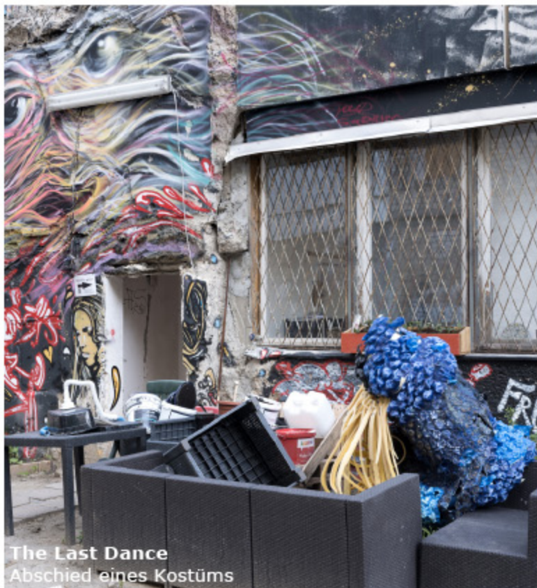
The Last Dance Abschied eines Kostüms