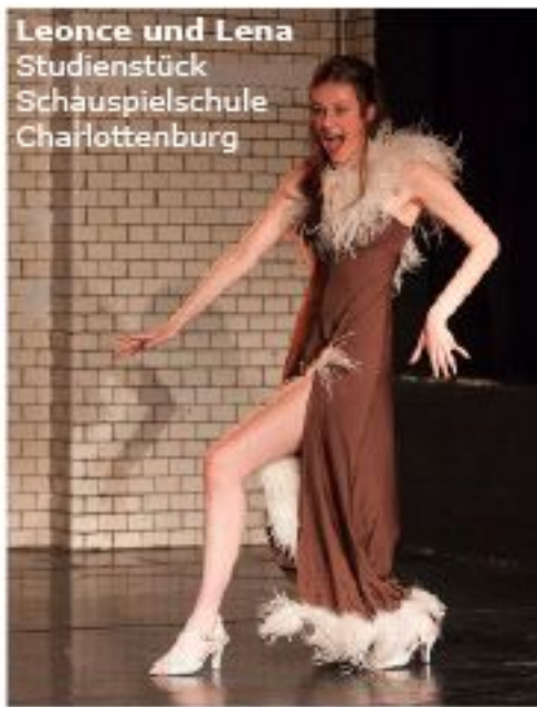
Leonce und Lena Studienstück Schauspielschule Charlottenburg