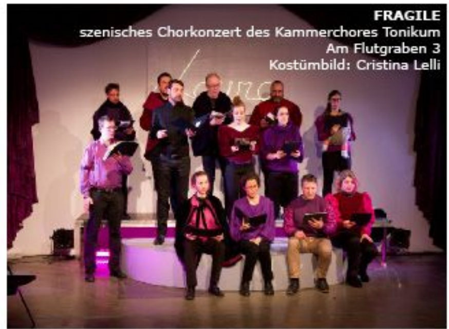
FRAGILE szenisches Chorkonzert des Kammerchores Tonikum Am Flutgraben 3 Kostümbild: Cristina Lelli