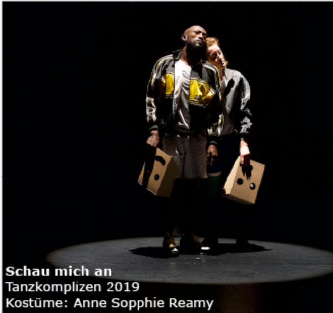
Schau mich an Tanzkomplizen 2019 Kostüme: Anne Soppie Reamy