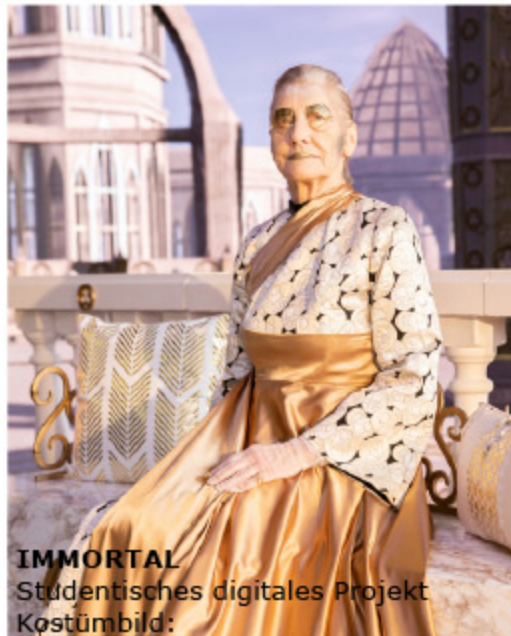
IMMORTAL Studentisches digitales Projekt Kostümbild: